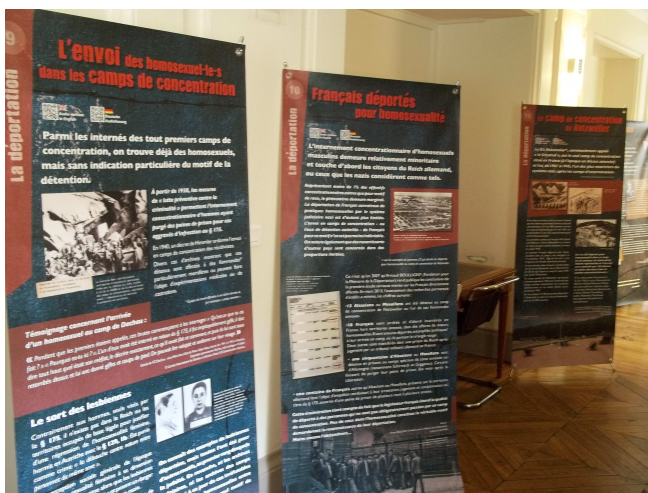
Présentation en la Mairie du 4 e ardt en avril 2013

Une assistance technique et toute information complémentaire peut être demandée à l'association au 06.18.84.00.33 – devoiretmemoire@yahoo.fr