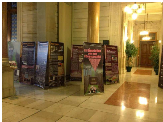
Présentation en la Mairie du 3 e ardt en novembre 2013